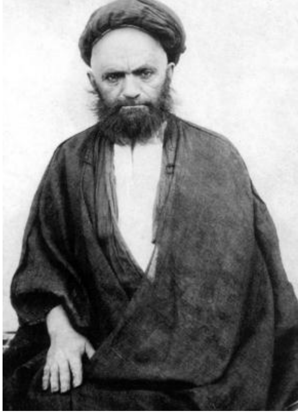
تصوير عارف كامل واصل، مرحوم آية الله العظمى علامه قاضى، رضوان الله عليه